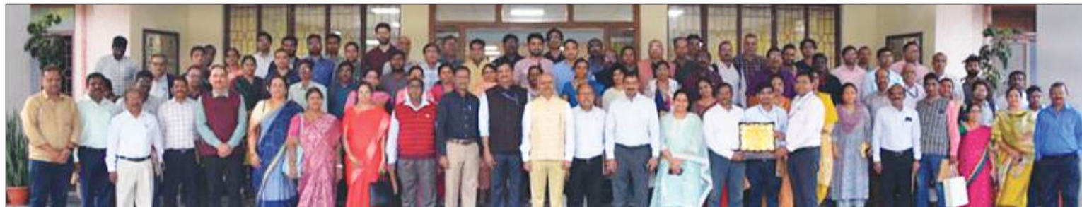
हैदराबाद, 30 नवंबर (शुभ लाभ ब्यूरो)।

राष्ट्रीय ग्रामीण विकास एवं पंचायती राज संस्थान के तत्वावधान में राष्ट्रीय वनस्पति स्वास्थ्य प्रबंधन संस्थान, हैदराबाद द्वारा नगर राजभाषा कार्यान्वयन समिति (नराकास-2) हैदराबाद की अर्धवार्षिक बैठक दिनांक 28 नवम्बर, 2024 को आयोजित की गई। बैठक का शुभारंभ गणेश वंदना तथा दीप प्रज्वलन से हुआ।