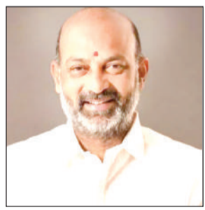
पुरस्कार विजेता अभिनेता की

हैदराबाद, 13 दिसंबर (शुभ लाभ ब्यूरो)। वरिष्ठ भाजपा नेता और केंद्रीय राज्य मंत्री, बंडी संजय कुमार ने शुक्रवार को सिने स्टार अल्लू अर्जुन की गिरफ्तारी के लिए कांग्रेस के नेतृत्व वाली तेलंगाना सरकार की आलोचना की। केंद्रीय मंत्री ने आरोप लगाया कि राष्ट्रीय