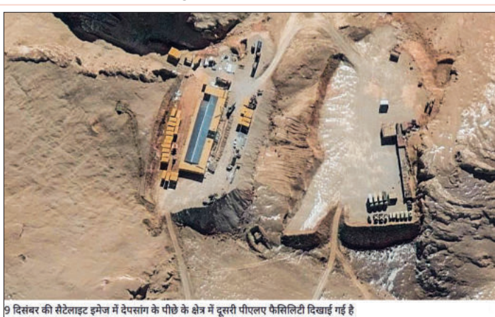
9 दिसंबर की सैटेलाइट इमेज में देपसांग के पीछे के क्षेत्र में दूसरी पीएलएफ कैम्पिस्ट्री दिखाई गई है

नई दिल्ली, 26 दिसंबर (एजेंसियां)। पूर्वी लद्दाख के देपसांग और डेमचोक के मैदानों में भारतीय और चीनी सेनाओं के बीच सैनिकों की वापसी पूरी हो गई है। इस बात की तस्वीरों से साफ पता चल रहा है कि सैनिकों को वापस बुला लिया गया है, लेकिन जब विवादित क्षेत्रों में बुनियादी ढांचे के तेजी से हो रहे निर्माण पर प्रकाश डाला गया, जिससे चीन की तनाव कम करने की दीर्घकालिक प्रतिबद्धता पर संदेह पैदा होता है।