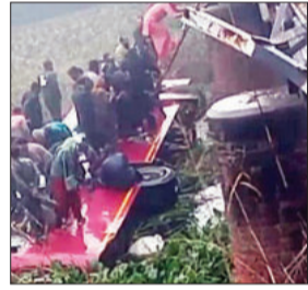
बठिंडा के जीवन सिंह वाला के पास बड़ा हादसा हो गया है।

पंजाब के बठिंडा जिले में सोमवार को एक दर्दनाक हादसा हुआ, जब एक यात्री बस अनियंत्रित होकर पुल से नाले में गिर गई। इस हादसे में अब तक आठ लोगों की मौत हो चुकी है, जबकि कई अन्य गंभीर रूप से घायल हो गए हैं। राहत और बचाव कार्य अभी भी जारी है।