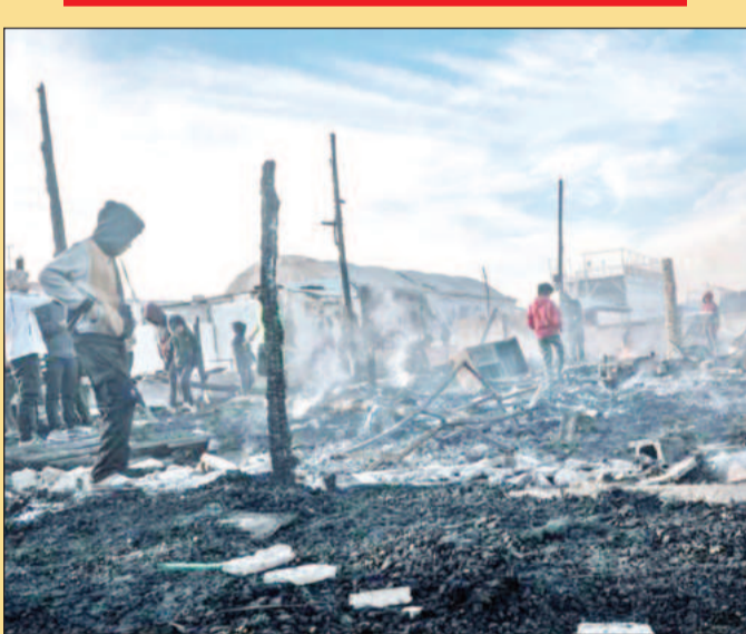
गाजा में इजरायली बमबारी के कारण ध्वस्त हुए टेंटों के पास खड़े हुए फिलिस्तीनी लोग।