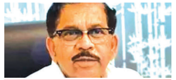
जाति जनगणना रिपोर्ट होनी चाहिए सार्वजनिक: गृह मंत्री @ नम्मा बेंगलूरु