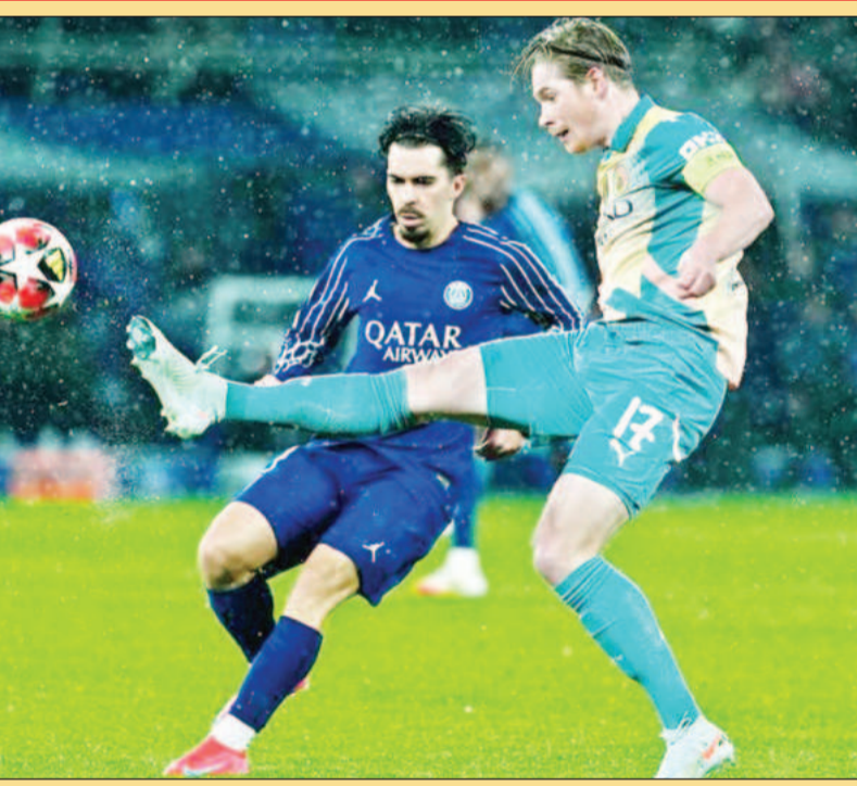
पेरिस में यूईएफए चैम्पियंस लीग फुटबॉल में पेरिस सेंट जर्मेन और मैनचेस्टर सिटी के खिलाड़ी खेलते हुए।