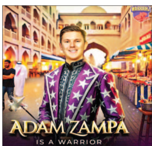
शारजाह वॉरियर्स ने एडम जम्पा को अपने साथ जोड़ा है। फ्रेंचाइजी ने गुरुवार को इसकी जानकारी दी।

फ्रेंचाइजी ने बताया कि शारजाह वॉरियर्स को ऑस्ट्रेलियाई क्रिकेटर एडम जम्पा के साथ अनुबंध की घोषणा करते हुए खुशी हो रही है, जो डीपी वर्ल्ड आईएलटी20 के सीजन 3 के शेष भाग के लिए श्रीलंकाई विकेटकीपर बल्लेबाज कुसल मंडिस की जगह लेंगे। पिप्परन जम्पा को टी20 क्रिकेट और फ्रेंचाइजी लोगों में खेलने का काफी अनुभव है। वह ऑस्ट्रेलिया में बिग बैश लीग, भारत में इंडियन प्रीमियर लीग (आईपीएल), कैरोबियन प्रीमियर लीग, ब्रिटेन में द हंड्रेड