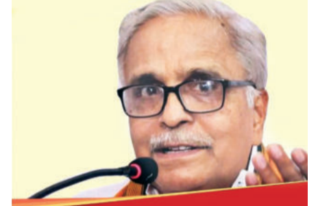
'वसुधैव कुटुंबकम्' हमारी आध्यात्मिकता की अवधारणा