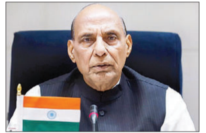
साइबर, स्पेस और एआई जैसे संवेदनशील क्षेत्रों पर होगा फोकस

रक्षा मंत्रालय ने 2025 को सुधारों का वर्ष घोषित किया है। देश के रक्षा मंत्री राजनाथ सिंह ने कहा कि वर्ष 2025 में रक्षा मंत्रालय साइबर और अंतरिक्ष जैसे नए क्षेत्रों और उभरती प्रौद्योगिकियों पर ध्यान केंद्रित करेगा। मंत्रालय सैन्य क्षमता के तीव्र विकास के लिए अधिग्रहण प्रक्रियाओं को भी सरल और समयबद्ध बनाएगा। रक्षा सुधार से एकीकृत सैन्य कमान की स्थापना में सुविधा होगी। केंद्र सरकार एकीकृत सैन्य कमान की शीघ्र स्थापना करने पर विचार कर रही है।