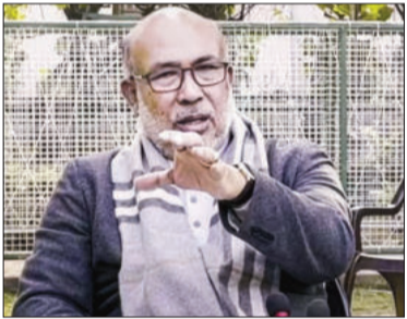
मैंने हिंसा से प्रभावित और पीड़ित लोगों से माफी मांगी है कांग्रेस को अपने पुराने पाप के लिए माफी मांगनी चाहिए

इंफाल, 01 जनवरी (एजेंसियां)। मणिपुर के मुख्यमंत्री एन बीरेन सिंह ने नए साल के मौके पर मणिपुर के लोगों से माफी तो मांगी है, लेकिन यह माफी कांग्रेस नेताओं के मुंह पर करारे तमाचे की तरह है। क्योंकि जिन्हें माफी मांगनी चाहिए थी, वे ओछी राजनीति की रोटी सेंक रहे हैं। मणिपुर हिंसा को लेकर चिह्नों मचा रही कांग्रेस अपने पुराने पाप छुपाने की कोशिश कर रही है। मणिपुर की मौजूदा हालात के लिए एकमात्र कांग्रेस जिम्मेदार है, जिसने मणिपुर को देश से काटने की कोशिश की और इस कुचक्र में म्यांमार और बाहरी देशों के उपस्थितियों को लाकर बसाया। मणिपुर के मूल वासियों के साथ बाहरी लोगों की भिड़ंत कराई, अफ्रीम की खेती का फायदा उठाया और मणिपुर को काट कर अंतरराष्ट्रीय ड्रग