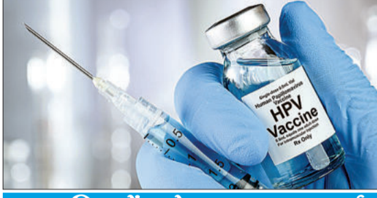
लड़कियों को जबरन लगाई जा रही एचपीवी वैक्सीन

मिलियन युवा भारतीय हैं। सर्वावैक वैक्सीन की विशेषताओं का विवरण देने वाले ड्रग कंट्रोलर जनरल ऑफ इंडिया को प्रस्तुत किए गए दस्तावेज के अनुसार, क्लिनिकल ट्रायल्स में केवल एक हजार पांच सौ तीस प्रतिभागी शामिल थे। दस्तावेज में कहा गया है कि प्रजनन क्षमता के संबंध में भावी क्लिनिकल अध्ययनों से कोई मानव डेटा उपलब्ध नहीं था। क्लिनिकल ट्रायल्स में 1,530 लोगों में से, 15 से 26 वर्ष की आयु की केवल 343 लड़कियों