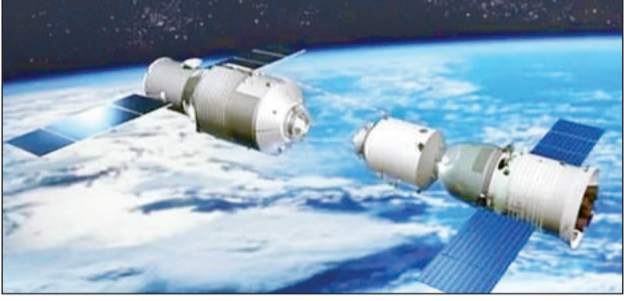
दो स्पेसक्राफ्ट की डॉकिंग कराने वाला भारत दुनिया का चौथा देश

नई दिल्ली, 16 जनवरी (एजेंसियां)। भारत की तकनीकी का पूरी दुनिया लोहा मान रही है। इसरो अंतरिक्ष में एक से बढ़कर एक नए कारनामे कर रहा है, इन्हीं कारनामों में से एक है स्पेस डॉकिंग। भारत ने सफलतापूर्वक को अंतरिक्ष यानों को आपस में सक्-सेसफुली डॉक कराने में सफलता हासिल की है। ऐसा करने वाला भारत दुनिया का चौथा देश बन गया है। रिपोर्ट के मुताबिक, आज यानी कि 16 जनवरी 2025 कि सुबह इसरो ने स्पेस में असंभव दिखने वाले इस मिशन को भी संभव कर