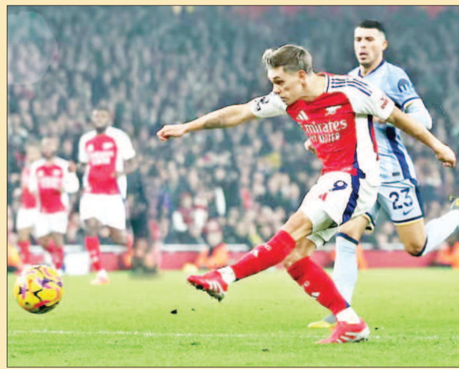
लंदन में प्रीमियर लीग फुटबॉल में खेलती हुई आर्सेनल और टोटनहम की टीमें