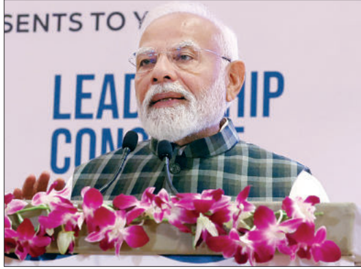
विकास यात्रा में एक बहुत महत्वपूर्ण और बड़ा कदम है। उन्होंने कहा कि आज हर भारतीय, 21वीं सदी के मविकसित भारतफ के लिए दिन-रात काम कर रहा है और ऐसे में 140 करोड़ लोगों के देश में भी हर क्षेत्र में और जीवन के हर पहलू

नई दिल्ली, 21 फरवरी (एजेंसियां)। प्रधानमंत्री नरेन्द्र मोदी ने शुक्रवार को कहा कि भारत एक वैश्विक महाशक्ति के रूप में उभर रहा है और इस गति को बनाए रखने के लिए हर क्षेत्र में बेहतरीन नेतृत्व का विकास समय की मांग है। राजधानी के भारत मंडप में 'स्कूल ऑफ अल्टीमेट लीडरशिप' (सोल) सम्मेलन का उद्घाटन करने के बाद अपने संबोधन में प्रधानमंत्री ने कहा कि इस तरह के अंतरराष्ट्रीय संस्थान केवल एक विकल्प नहीं, बल्कि आवश्यकता है। उन्होंने कहा, कुछ आयोजन ऐसे होते हैं, जो हृदय के बहुत करीब होते हैं और आज का ये कार्यक्रम भी ऐसा ही है। राष्ट्र निर्माण के लिए नागरिकों का विकास जरूरी है, व्यक्ति निर्माण से राष्ट्र निर्माण, जन से जगत... किसी भी ऊंचाई को प्राप्त करना है, तो आरंभ जन से ही शुरू होता है। हर क्षेत्र में बेहतरीन नेतृत्व का विकास बहुत जरूरी है और यह समय की मांग है। मोदी ने कहा कि सोल की स्थापना इविकसित भारतफ की