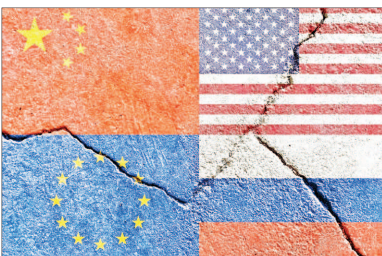
महाजुटान के दौरान की गई ये टिप्पणियां बीजिंग वृद्धि की घोषणा के कुछ दिनों बाद आई हैं। यह सरकार के लगभग 5 प्रतिशत के वार्षिक जीडीपी

सैन्य प्रवक्ता वू ने ताइवान को सीधी चेतावनी देते हुए कहा, 'पीएलए (पीपुल्स लिबरेशन आर्मी) अलगाववाद का मुकाबला करने और एकीकरण को बढ़ावा देने में एक्टिव पावर है। आप अपने घोड़े को चट्टान के किनारे तक ले गए हैं। यदि आप गलत रास्ता अपनाते रहेंगे तो आप डेड एंड तक पहुंच जाएंगे।' चीन की सालाना राजनीतिक