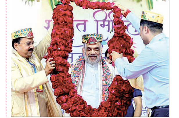
सीता माता मंदिर पूरी दुनिया को नारी शक्ति का संदेश देगा

बिहार चुनाव से पहले अमित शाह का बड़ा ऐलान राम मंदिर के बाद अब सीता माता मंदिर की बारी