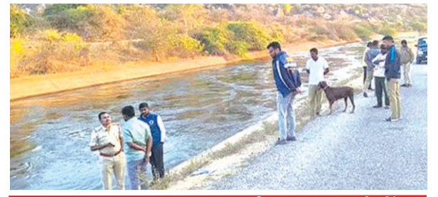
हम्पी सामूहिक बलात्कार और हत्या मामले में तीसरा आरोपी गिरफ्तार @ नम्मा बेंगलूरु

Postal Regd.No. HQ/SD/523/2023-25 | मंगलवार, 11 मार्च, 2025 | हैदराबाद और नई दिल्ली से प्रकाशित | website : https://www.shubhlabdaily.com | संपादक : गोपाल अग्रवाल | पृष्ठ : 14 | मूल्य-6 रु. | वर्ष-7 | अंक-69