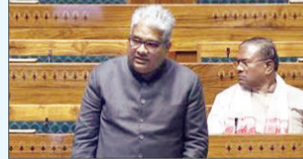
सीपीसीबी ने 12 जनवरी, 2025 से संगम नोज (गंगा और यमुना के संगम बिंदु) सहित श्रृंगवेरपुर घाट (प्रयागराज के ऊपर) से दीहाघाट (प्रयागराज के नीचे) तक के खंड में सात स्थानों (सप्ताह में दो बार) पर नियमित जल गुणवत्ता ▶10