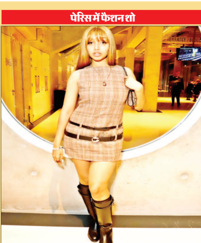
पेरिस में फैशन शो के दौरान परिधानों को पेश करती हुई एक मॉडल।