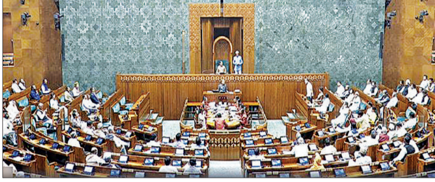
शिक्षा मंत्री धर्मेंद्र प्रधान के जवाब के बाद द्रमुक सदस्यों ने किया हंगामा

नई दिल्ली, 10 मार्च (एजेंसियां)। संसद के बजट सत्र का दूसरा चरण आज से शुरू हुआ। पहले ही दिन विपक्ष और सरकार के बीच राष्ट्रीय शिक्षा नीति (एनईपी) के माध्यम से कथित तौर पर 'हिंदी' भाषा थोपे जाने को लेकर एक बार फिर टकराव देखने को मिला। डीएमके सांसदों ने केंद्र पर शिक्षा निधि रोकने का आरोप लगाया और सवाल किया कि क्या राज्य सरकार के खिलाफ राजनीतिक प्रतिशोध के लिए स्कूल फंड का इस्तेमाल करना उचित है। केंद्रीय शिक्षा मंत्री धर्मेंद्र प्रधान ने हमले का जवाब दिया और विरोध करने वाले सदस्यों पर एनईपी पर देश को गुमराह करने का आरोप लगाया। इसके साथ ही राहुल गांधी ने मतदाता सूची के मुद्दे पर लोकसभा में चर्चा की मांग उठाई। वहीं, संसद के दोनों सदनों ने आईसीसी चैम्पियंस ट्रॉफी जीतने पर सोमवार को भारतीय क्रिकेट टीम को बधाई दी और भविष्य के मुकाबलों के लिए शुभकामनाएं दीं। लोकसभा में सोमवार को राष्ट्रीय शिक्षा नीति को लेकर द्रमुक सदस्यों के हंगामे के कारण कार्यवाही आधे घंटे के लिए स्थगित करनी पड़ी। शिक्षा मंत्री