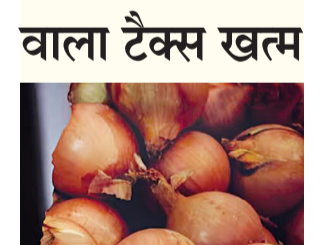
नई दिल्ली 24 मार्च (एजेंसियां)। केंद्र सरकार ने प्याज पर लगने वाले 20 प्रतिशत निर्यात शुल्क को पूरी तरह खत्म कर दिया है। मोदी सरकार ने प्याज पर लगने वाले 20 प्रतिशत एक्सपोर्ट टैक्स को पूरी तरह समाप्त करने का महत्वपूर्ण निर्णय लिया है। किसानों के हित में लिया गया यह