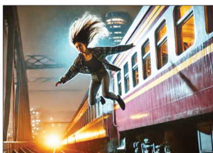
हैदराबाद, 24 मार्च (शुभ लाभ ब्यूरो)। महिलाओं पर अपराध से जुड़े एक मामले ने तेलंगाना के लोगों को चौंका दिया है। छेड़छाड़ से परेशान युवती ने चलती ट्रेन से छलांग दी। उसे गंभीर चोटें आई हैं। गंभीर हालत में उसे अस्पताल

में भर्ती कराया गया है। हैदराबाद में दिल दहला देने वाली घटना घटी। यहां एक युवती ने खुद को बदमाशों से बचाने के लिए चलती ट्रेन से छलांग लगा दी। चलती ट्रेन से कूदने के कारण 23 वर्षीया युवती गंभीर रूप से घायल हो गई। ट्रेन के कोच में ही युवती के साथ दुष्कर्म करने का प्रयास किया गया। सरकारी रेलवे पुलिस ने इस घटना की आधिकारिक पुष्टि की। हैदराबाद के एक अस्पताल में इलाज करा रही पीड़िता ने रविवार को पुलिस को दिए बयान में कहा कि यह घटना 22 मार्च की शाम को हुई, जब वह सिकंदराबाद रेलवे स्टेशन से मेडचल के लिए एमएमटीएस (मल्टी मॉडल ट्रांसपोर्ट सर्विस) ट्रेन के महिला कोच में अकेली यात्रा कर रही थी। ▶10