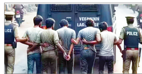
बांग्लादेशी घुसपैठियों के बच्चे भारत में कमजोर आर्थिक वर्ग (ईडब्ल्यूएस) का लाभ उठा रहे थे। घुसपैठिए बांग्लादेश से एक-एक कर यहां अपने परिवार के लोगों को बुलाते हैं। कुछ ने तो भारतीय महिलाओं से निकाह

नई दिल्ली, 24 मार्च (एजेंसियां)। दिल्ली और असम से पकड़े गए 19 घुसपैठियों को वापस उनके मुल्क बांग्लादेश धकेल दिया गया है। घुसपैठियों को डिपोर्ट करने का काम तेजी से चालू कर दिया गया है। दिल्ली पुलिस ने 18 बांग्लादेशी घुसपैठिए पकड़े। इन बांग्लादेशी घुसपैठियों को भारत में बसाने में मदद करने वाले 8 भारतीय भी गिरफ्तार किए गए, जो बांग्लादेशी घुसपैठियों को भारत में कागज दिलाने से लेकर उनको नौकरी दिलाने तक का काम करता था। दिल्ली के अलावा असम में भी बांग्लादेशी घुसपैठियों की घर-पकड़ तेजी से की जा रही है। असम सरकार ने सुप्रीम कोर्ट को बताया है कि असम के माटिया ट्रान्जिट कैम्प में हिरासत में लिये गए 63 में से 13 बांग्लादेशी घुसपैठियों को वापस भेज दिया गया है। बाकी 50 बांग्लादेशी घुसपैठियों के कागज जांचे जा रहे हैं। इससे पहले 4 फरवरी 2025 को सुप्रीम कोर्ट ने असम सरकार से ट्रान्जिट कैम्प में रखे गए 63 लोगों को लेकर एक्शन न लिए जाने को लेकर सवाल किया था।