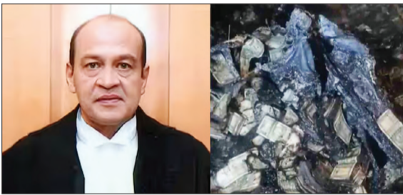
याचिका में उठा सवाल: भ्रष्ट जजों को क्यों मिले कानून से छूट? प्रयागराज ट्रांसफर किए जाने पर वकीलों ने की सांकेतिक हड़ताल