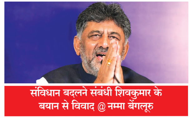
संविधान बदलने संबंधी शिवकुमार के बयान से विवाद @ नम्मा बेंगलूरु

Postal Regd.No. HQ/SD/523/2023-25 | मंगलवार, 25 मार्च, 2025 | हैदराबाद और नई दिल्ली से प्रकाशित | website : https://www.shubhlabdaily.com | संपादक : गोपाल अग्रवाल | पृष्ठ : 14 | मूल्य-6 रु. | वर्ष-7 | अंक-82