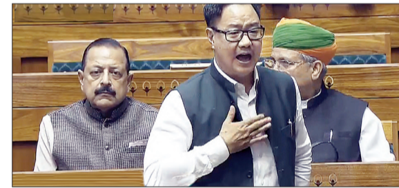
कर्नाटक के डिप्टी सीएम शिवकुमार के बयान पर बवाल, कर्नाटक से दिल्ली तक बवाल, भाजपा ने इस्तीफा मांगा

नई दिल्ली/बेंगलूरु, 24 मार्च (एजेंसियां)। कर्नाटक में मुस्लिमों को आरक्षण देने के मसले पर हो रहे विवाद के बीच उप मुख्यमंत्री डीके शिवकुमार ने कहा कि ऐसी स्थिति आई तो संविधान बदला भी जा सकता है। संविधान बदलने को लेकर दिए बयान के बाद कर्नाटक के साथ देश की राजधानी दिल्ली में सियासी घमासान छिड़ गया है। राज्यसभा में भी डीके शिवकुमार के बयान को लेकर जमकर हंगामा हुआ। डीके शिवकुमार के बयान को भाजपा ने कांग्रेस की मंशा का खुला सबूत करार दिया और कहा कि यह तुष्टिकरण की