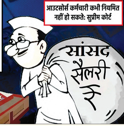
आउटसोर्स कर्मचारी कमी नियमित नहीं हो सकते: सुप्रीम कोर्ट

→ लाखों सैनिकों का सम्मानजनक वेतन-पेंशन छीनने में उन्हें शर्म नहीं आई → आउटसोर्सिंग से लाखों कर्मचारियों का शोषण करने में उन्हें शर्म नहीं आई