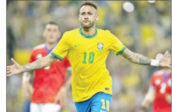
रियो डी जेनेरो, 01 मार्च (एजेंसियां)।

नेमार को कोलंबिया और अर्जेंटीना के खिलाफ विश्व कप क्वालीफायर के लिए ब्राजील की प्रारंभिक टीम में शामिल किया गया है। ब्राजील फुटबॉल परिसंघ (सीबीएफ) ने शुक्रवार को उक्त जानकारी दी। 33 वर्षीय खिलाड़ी ने अक्टूबर 2023 में मोटोवीडियो में उरुग्वे के खिलाफ विश्व कप क्वालीफायर के दौरान अपने बाएं घुटने में एंटीरियर क्रूसिए लिगामेंट के फटने के बाद से अपने देश का प्रतिनिधित्व नहीं किया है।