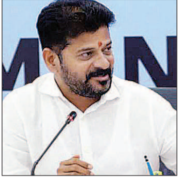
हैदराबाद, 01 मार्च (शुभ लाभ ब्यूरो)।

तेलंगाना के मुख्यमंत्री ए. रेवंत रेड्डी ने कहा है कि राज्य सरकार जल्द ही स्वास्थ्य पर्यटन नीति पेश करेगी। श्री रेड्डी ने शुक्रवार की देर शाम को एआईजी हॉस्पिटल्स के अध्यक्ष डॉ. डी नागेश्वर रेड्डी के सम्मान में आयोजित समारोह को संबोधित करते हुए कहा कि तेलंगाना को स्वास्थ्य केंद्र के रूप में बढ़ावा देने के लिए प्रयास किया जा रहा है, ताकि न केवल राज्य के लोगों को बल्कि अन्य देशों को भी सेवा मिल सके।