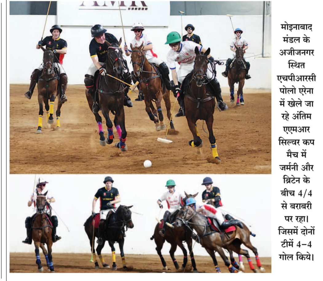
मोड़नाबाद मंडल के अजीजनगर स्थित एचपीआरसी पोलो एरिना में खेले जा रहे अंतिम एएमआर सिल्वर कप मैच में जर्मनी और ब्रिटेन के बीच 4/4 से बराबरी पर रहा। जिसमें दोनों टीमों 4-4 गोल किये।