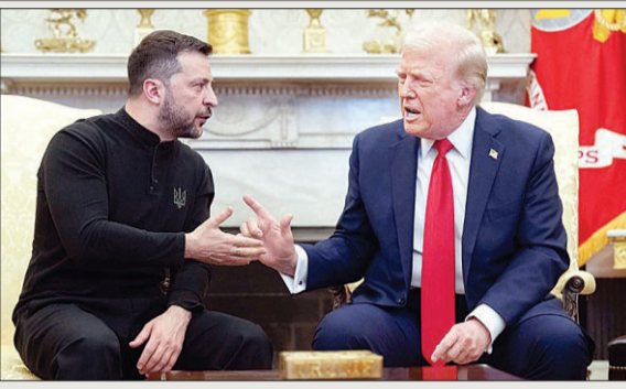
जेलेंस्की के बर्ताव पर भड़के ट्रंप व्हाइट से बाहर का रास्ता दिखाया यूक्रेनी राष्ट्रपति के अमर्यादित व्यवहार की दुनियाभर में हो रही निंदा

ट्रंप ने जेलेंस्की को व्हाइट से बाहर का रास्ता दिखा दिया। जेलेंस्की के इस व्यवहार की दुनियाभर में निंदा हो रही है। अंतरराष्ट्रीय नेताओं का कहना है कि यूक्रेन जिस अमेरिका का दिया खाना खा रहा है, उसने उस खाने का अपमान किया है। अमेरिकी राष्ट्रपति डोनाल्ड ट्रंप और यूक्रेन के राष्ट्रपति वोलोदिमिर जेलेंस्की की व्हाइट हाउस में मुलाकात बड़े ड्रामे के साथ खत्म हुई। यह बैठक शुरुवार 28 फरवरी को वाशिंगटन डीसी में हुई, लेकिन तय समय से पहले ही जेलेंस्की वहां से चले गए। जॉइंट प्रेस