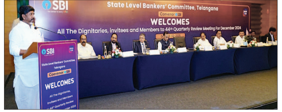
हैदराबाद, 01 मार्च (शुभ लाभ ब्यूरो)।

उपमुख्यमंत्री भट्टी विक्रमार्क ने घोषणा की कि मुख्यमंत्री रेवंत रेड्डी बेरोजगार युवाओं के स्वरोजगार के लिए 2 मार्च को वानापथी में 6,000 करोड़ रुपये की योजना का शुभारंभ करेंगे। उन्होंने कहा कि अनुसूचित जाति, अनुसूचित जनजाति, पिछड़ा वर्ग तथा अल्पसंख्यक निगमों के माध्यम से स्वरोजगार योजनाओं के तहत इकाइयों का वितरण उत्सव की तरह किया जाएगा तथा बैंकर्स को ऋण स्वीकृत करने के लिए आगे आने के लिए कहा जाएगा।