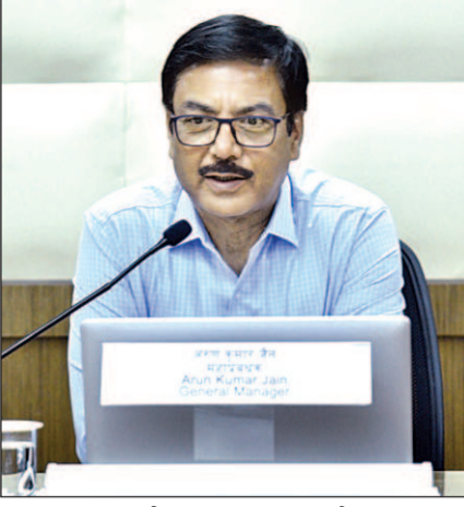
हैदराबाद, 03 मार्च ।