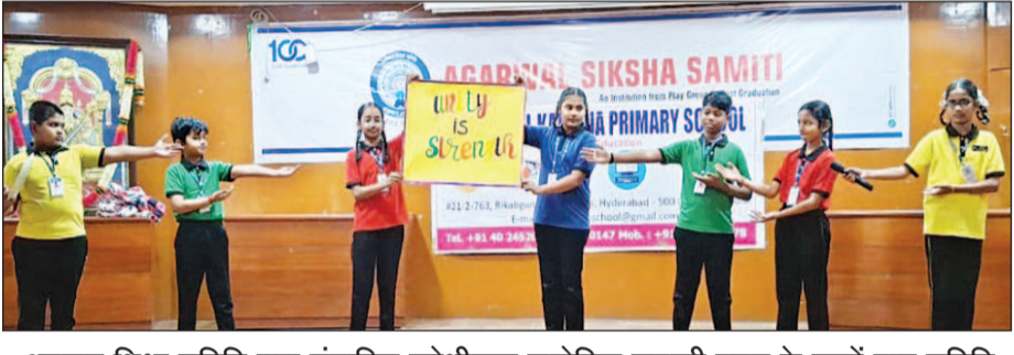
अग्रवाल शिक्षा समिति द्वारा संचालित गणेशीलाल कनोडिया प्राइमरी स्कूल के छात्रों द्वारा समिति के सेडमल हॉल में विभिन्न साहित्यिक गतिविधियां आयोजित की गई।