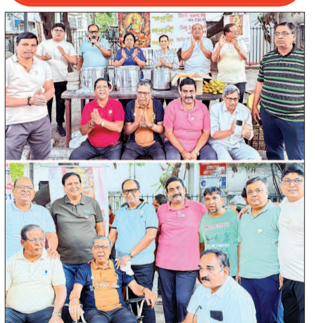
राधे राधे ग्रुप द्वारा नियमित अन्नदान के अंतर्गत गुरुवार को नामपल्ली स्थित पब्लिक गार्डन, पिलर नं. ए1265 के समीप जरूरतमंद लोगों में अल्पाहार सेवा की गई। इस अवसर पर राधे राधे ग्रुप के सदस्य उपस्थित थे।