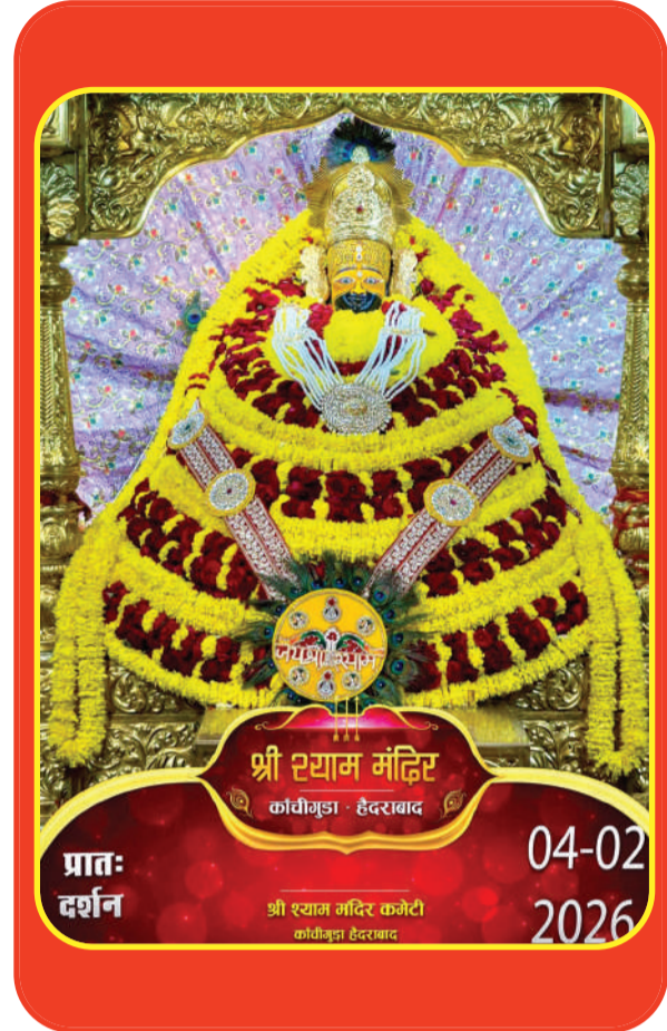
श्री श्याम मंदिर कांचीगुड़ा हैदराबाद प्रातः दर्शन 04-02 2026 श्री श्याम मंदिर कमेटी कांचीगुड़ा हैदराबाद