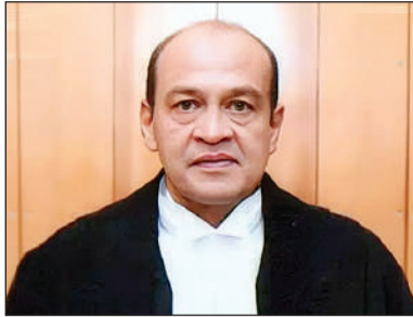
और जांच का सिलसिला शुरू हुआ।