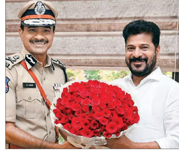
हैदराबाद, 28 अप्रैल (शुभ लाभ ब्यूरो):

राज्य में पहले चरण में 93.19 प्रतिशत मतदान दर्ज होने के बाद बनर्जी ने दावा किया था कि तृणमूल कांग्रेस पहले ही 100 सीट का आंकड़ा पार कर चुकी है। यह राज्य में अब तक का सबसे अधिक मत प्रतिशत है। खटन ने नाम हटाए जाने के मुद्दे को दूसरे चरण का संभवतः सबसे संवेदनशील राजनीतिक मुद्दा बना दिया है। उत्तर 24 परगना में वोटर लिस्ट से 12.6 लाख से अधिक नाम हटाए गए, दक्षिण 24 परगना में 10.91 लाख से अधिक, कोलकाता में लगभग 6.97 लाख, हावड़ा में लगभग छह लाख, हुगली में 4.68 लाख और नदिया में लगभग 4.85 लाख नाम हटाए गए। कम से कम 25 विधानसभा क्षेत्रों में हटाए गए नामों की संख्या पिछली जीत के अंतर से कहीं अधिक है। राजनीतिक विश्लेषकों का मानना है कि जिन क्षेत्रों में जीत का अंतर हटाए गए नामों की तुलना में कम है, वहां एसआईआर न केवल चुनाव परिणामों को, ▶8र