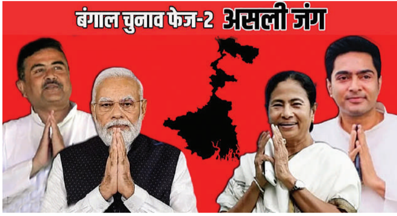
बंगाल चुनाव फेज-2 असली जंग

पांच साल पहले भाजपा के आक्रामक प्रचार अभियान के बावजूद ममता बनर्जी की टीएमसी ने दक्षिण बंगाल में शानदार प्रदर्शन किया और राज्य की सत्ता पर अपना कब्जा बरकरार रखा। इस नतीजे ने स्पष्ट कर दिया कि अगर आपको पश्चिम बंगाल की सत्ता चाहिये, तो दक्षिण बंगाल को जीतना सबसे जरूरी है। भवानीपुर विधानसभा सीट पर भी इसी चरण में मतदान होना है, जो मुख्यमंत्री ममता बनर्जी का गढ़ है और बीजेपी ने यहां नेता प्रतिपक्ष