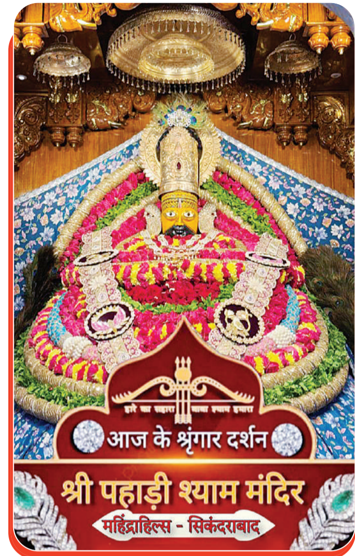
आज के श्रृंगार दर्शन श्री पहाड़ी श्याम मंदिर महिंद्राहिल्स - सिकंदराबाद