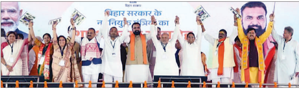
पटना, 07 मई (एजेंसियां)।

पटना के गांधी मैदान में 7 मई को सम्राट चौधरी के मंत्रिमंडल का विस्तार हो गया। इसके साथ तीन हफ्ते पहले अस्तित्व में आई बिहार की नई सरकार का न सिर्फ आकार, बल्कि जश्र भी पूरा हो गया। मंत्रिमंडल विस्तार में कुल 32 मंत्रियों ने शपथ ली और इस तरह बिहार मंत्रिमंडल का अधिकतम 36 सदस्यों का कोटा लगभग पूरा हो गया। इससे पहले मुख्यमंत्री सम्राट चौधरी के साथ दो उपमुख्यमंत्री विजय चौधरी और बिजेंद्र प्रसाद यादव ने शपथ ली थी। इस तरह अब सम्राट चौधरी के मंत्रिमंडल में उनके अलावा 34 और सदस्य हो गए। इसकी खासियत यह रही कि नीतीश कुमार के पुत्र निशांत भी आखिरकार सरकार का हिस्सा बन गए, जिसकी चर्चा लंबे समय से जारी थी।