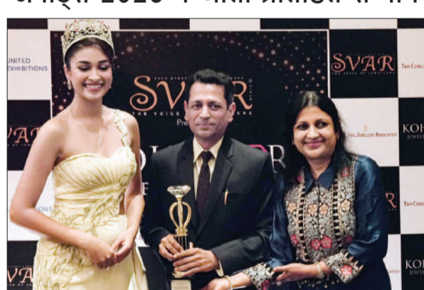
हैदराबाद, 08 मई (शुभ लाभ ब्यूरो): गुणवत्ता, विश्वास, पवित्रता और नवाचार के 43 वर्ष (03 मूल मूल्य रत्न और आभूषण उद्योग में कृष्णा पर्ल एंड ज्वैलर्स की उत्कृष्टता की यात्रा को निरंतर परिभाषित कर रहे हैं। अपनी शिल्प कौशल और विश्वसनीयता की विरासत को और मजबूत करते हुए, ब्रांड को दक्षिण भारत की सबसे बड़ी बी2बी ज्वैलरी प्रदर्शनी, 'हाइज' एचआईजेएस-हैदराबाद इंटरनेशनल ज्वैलरी शो) में आयोजित प्रतिष्ठित कोहिनूर ज्वैलरी अवार्ड्स 2026 से सम्मानित किया गया है।