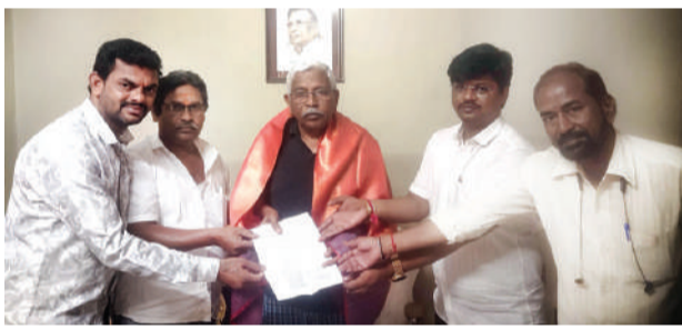
बांसवाड़ा, 29 मई (शुभ लाभ ब्यूरो)।