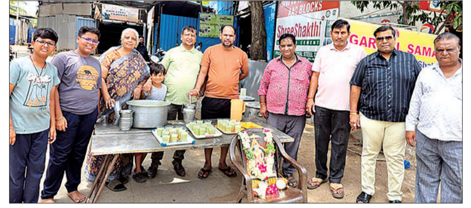
हैदराबाद, 29 मई (शुभ लाभ ब्यूरो)।

भीषण गर्मी में राहगीरों और श्रमिकों को पहुंचाई राहत