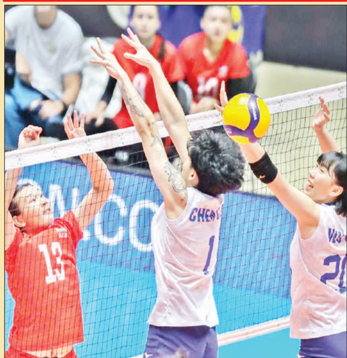
फिलीपींस में एवीसी महिला कप में भाग लेती हुई चीनी ताइपे और उज्बेकिस्तान की खिलाड़ी।