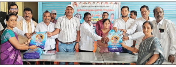
बांसवाड़ा, 10 जून (शुभ लाभ ब्यूरो)। राज्य सरकार के प्रमुख कार्यक्रमों एवं जनकल्याणकारी योजनाओं के संबंध में नागरिकों में जागरूकता बढ़ाने के उद्देश्य से तेलंगाना सरकार के निर्देशानुसार बांसवाड़ा नगर पालिका क्षेत्र में विशेष वार्ड बैठकों का आयोजन किया गया। सरकार द्वारा 4, 6, 8 और 10 जून 2026 को वार्ड स्तर पर विशेष बैठकों आयोजित करने के निर्देश जारी किए गए थे। इसी क्रम में नगर पालिका अध्यक्ष की अध्यक्षता में चार वार्डों में विशेष बैठकें आयोजित की गईं, जिनमें विभिन्न विभागों से संबंधित योजनाओं, विकास कार्यों एवं नागरिक सुविधाओं पर विस्तार से चर्चा करते हुए आमजन को जागरूक किया गया। बैठकों में सॉलिड वेस्ट मैनेजमेंट रूल्स-2026 के प्रभावी क्रियान्वयन, गीले एवं सूखे कचरे के पृथक्करण तथा वैज्ञानिक कचरा प्रबंधन के संबंध में जानकारी दी गई। इसके साथ ही जल संवय-जल भागीदारी योजना के अंतर्गत वर्षा जल संरक्षण संरचनाओं के निर्माण एवं जल संरक्षण के महत्व पर लोगों को जागरूक किया गया।

मॉनसून को ध्यान में रखते हुए सीमा लाइनों की सफाई, नालों की डी-सिल्टिंग, जलभराव रोकने के उपाय तथा मॉनसून एक्शन प्लान के विभिन्न पहलुओं पर भी चर्चा की गई। पीने के पानी की आपूर्ति एवं उसके बेहतर प्रबंधन से संबंधित विषयों पर भी जानकारी प्रदान की गई। बैठकों में राज्य सरकार की विभिन्न कल्याणकारी एवं विकास योजनाओं, महिला सशक्तिकरण कार्यक्रमों, स्वयं सहायता समूहों (सेल्फ हेल्प ग्रुप) को सुदृढ़ बनाने की पहल, रोजगार एवं कौशल विकास कार्यक्रमों तथा युवाओं के कल्याण से संबंधित योजनाओं की जानकारी दी गई। इसके अलावा ग्रामीण एवं शहरी आधारभूत संरचना विकास, सड़क एवं स्ट्रीट लाइटों के रखरखाव, वृक्षारोपण, पर्यावरण संरक्षण गतिविधियों, शिक्षा, स्वास्थ्य एवं सामाजिक सुरक्षा कार्यक्रमों के बारे में भी विस्तार से बताया गया। बैठकों में विभिन्न विभागों द्वारा संचालित योजनाओं की प्रगति, नागरिकों को उपलब्ध कराई जा रही सेवाओं तथा शिकायत निवारण व्यवस्था पर चर्चा की गई। साथ ही सेसपूल निर्माण, स्वच्छता प्रबंधन एवं पर्यावरण संरक्षण संबंधी उपायों के प्रति भी लोगों को जागरूक किया गया।