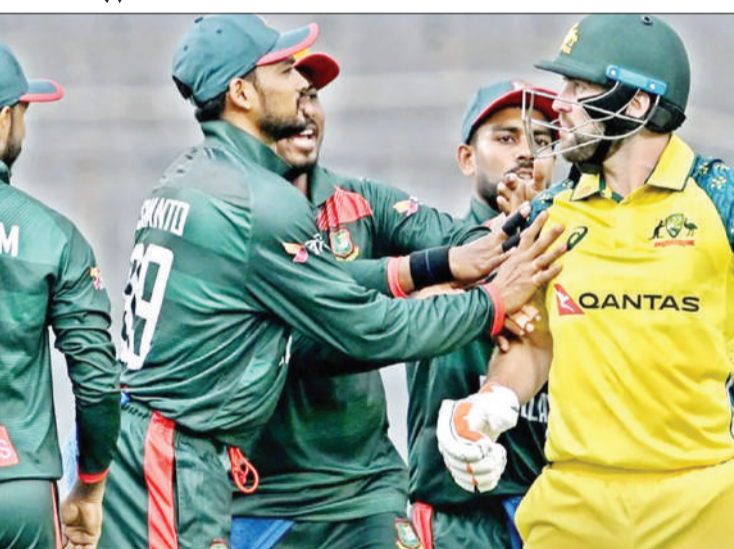
गौरतलब है कि आस्ट्रेलिया और बांग्लादेश के बीच अब तक खेले गए 23 एकदिवसीय मुकाबलों में यह बांग्लादेश की अब तक की दूसरी जीत है। इससे पहले, 2005 में कार्डिफ में नेटवेस्ट ट्राफी के दौरान बांग्लादेश ने आस्ट्रेलिया को हराया था। इस मुकाबले में आस्ट्रेलिया के कार्यवाहक कप्तान जोश इंग्लिस ने टास जीतकर आस्ट्रेलिया को टीम में पहले बल्लेबाजी के लिए बुलाया। मेजबान टीम ने पहले बल्लेबाजी करते

बांग्लादेश क्रिकेट टीम ने मेहमान आस्ट्रेलियाई टीम को यहां खेले गये पहले ही एकदिवसीय क्रिकेट मैच में 86 रनों से हराकर एक बड़ी उपलब्धि अपने नाम की है। इस प्रकार बांग्लादेश टीम ने एकदिवसीय अंतरराष्ट्रीय में 21 साल बाद आस्ट्रेलियाई टीम पर जीत हासिल की है। इससे पहले उसे अंतिम बार जीत साल 2005 में मिली थी। बारिश की बाधा के बीच ही मेजबान बांग्लादेश टीम ने तीन मैचों की एकदिवसीय सीरीज का पहला मुकाबला डकवर्थ लुइस नियम से जीता। इस प्रकार ये जीत बांग्लादेश क्रिकेट इतिहास की सबसे बड़ी जीत साबित हुई है। इस जीत के साथ ही बांग्लादेश ने कई साल से आस्ट्रेलिया के हाथों मिली हार के सिलसिले को तोड़ दिया।