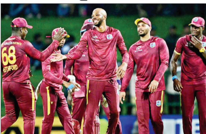
और उन्होंने सात पारियों में सिर्फ 78 रन बनाए। अल्जारी जोसेफ की वापसी से गेंदबाजी को मजबूती तैज गेंदबाज अल्जारी जोसेफ पीठ की चोट से

एट्रिगुआ। वेस्टइंडीज क्रिकेट बोर्ड (सीडब्ल्यूआई) ने श्रीलंका के खिलाफ आगामी वनडे श्रृंखला के लिए रविवार को टीम की घोषणा कर दी है। स्टार बल्लेबाज शिमरान हेटमायर की एक बार फिर वनडे टीम में वापसी हुई है, जबकि तेज गेंदबाज अल्जारी जोसेफ चोट से उबरने के बाद अंतरराष्ट्रीय क्रिकेट में लौटने के लिए तैयार हैं। क्रिकेट वेस्टइंडीज ने स्पष्ट किया है कि हेटमायर को 2027 वनडे विश्व कप की तैयारियों को ध्यान में रखते हुए टी20 में दोबाया शामिल किया गया है। हेटमायर ने आखिरी बार जून 2025 में इंग्लैंड के खिलाफ वनडे मैच खेला था। इसके बाद वह पाकिस्तान, बांग्लादेश और न्यूजीलैंड के खिलाफ हुई तीन वनडे श्रृंखलाओं से बाहर रहे थे। हाल ही में हुए टी20 विश्व कप में हेटमायर ने शानदार प्रदर्शन करते हुए 248 रन बनाए थे। हालांकि आईपीएल 2026 में राजस्थान रायल्स के लिए उनका प्रदर्शन उम्मीद के मुताबिक नहीं रहा