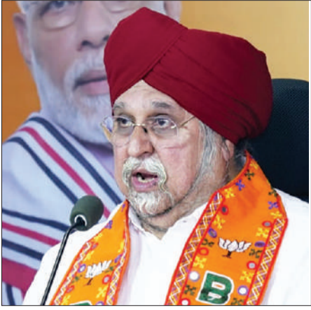
सामान्य हथियार मानकर आपराधिक मामला दर्ज करना तथ्यों की गलत व्याख्या हो सकती है। सिख समाज ने मुख्यमंत्री, राज्यपाल तथा पुणे पुलिस

हैदराबाद, 14 जून (शुभ लाभ ब्यूरो)। पुणे में एक सिख युवक को कथित रूप से तलवार रखने के आरोप में गिरफ्तार किए जाने की घटना को लेकर सिख समाज एवं विभिन्न नागरिक संगठनों ने चिंता व्यक्त करते हुए मामले की निष्पक्ष जांच की मांग की है। सिख समाज के प्रतिनिधियों का कहना है कि सिख धर्म में किरपान पाँच ककारों में से एक महत्वपूर्ण धार्मिक प्रतीक है, जिसे गुरु गोबिंद सिंह जी द्वारा खालसा पंथ की स्थापना के समय अनिवार्य किया गया था। उनके अनुसार किरपान आक्रमण का साधन नहीं, बल्कि धर्म, न्याय और कमजोरों की रक्षा के संकल्प का प्रतीक है। समाज के प्रतिनिधियों ने कहा कि भारतीय संविधान के अनुच्छेद 25 तथा शस्त्र अधिनियम, 1959 की धारा 4(2) के अंतर्गत सिखों को धार्मिक कारणों से किरपान धारण करने की संवैधानिक अनुमति प्राप्त है। उनका कहना है कि धार्मिक परंपराओं से जुड़े प्रतीकों को