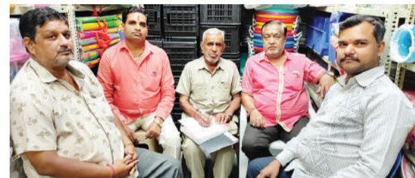
हैदराबाद, 28 जून (शुभ लाभ ब्यूरो)।

श्री सिखवाल ब्राह्मण समाज भाग्यनगर के तत्वावधान में भगवान श्री जगन्नाथ जी, श्री बलभद्र जी एवं श्री सुभद्रा माई की ज्येष्ठा अभिषेक (स्नान यात्रा) का आयोजन सोमवार, 29 जून 2026 को श्रद्धा एवं भक्तिभाव के साथ किया जाएगा।