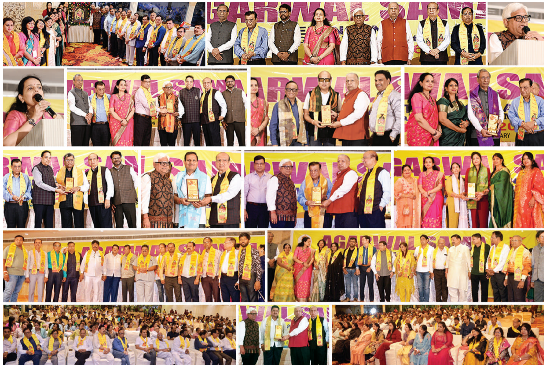
अग्रवाल समाज तेलंगाना की पहली आम सभा (एजीएम) रविवार को सिकंदराबाद स्थित क्लासिक गार्डन में बड़े उत्साहजनक व जोशीले वातावरण में संपन्न हुई।