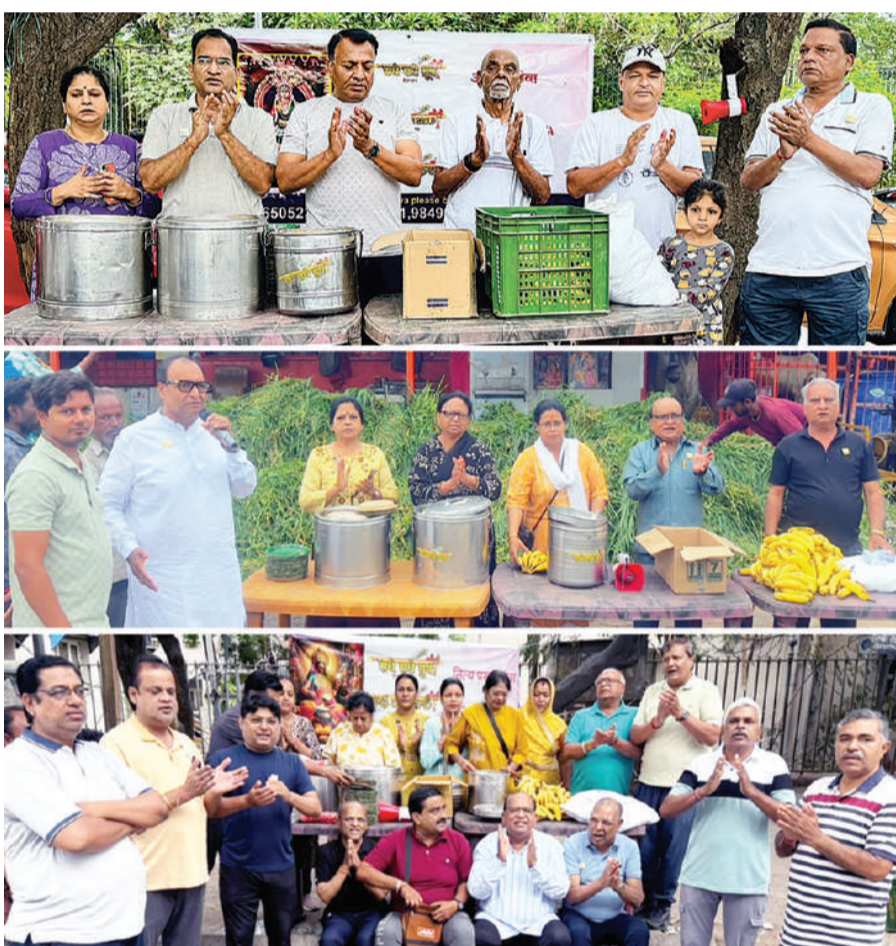
राधे राधे ग्रुप, हैदराबाद द्वारा आषाढ मास, कृष्ण पक्ष की द्वितीया तिथि के पावन अवसर पर सुबह 8:01 बजे नित्य अन्नदान (अल्पाहार) सेवा का भव्य आयोजन केबीआर पार्क (ईडो अमेरिकन कैंसर अस्पताल के पास), बेगमबाजार (गौशाला के पास), पुल की माता और पब्लिक गार्डन (पिलर संख्या-ए1265, नामपल्ली) के पास श्रद्धा के साथ संपन्न की गई।