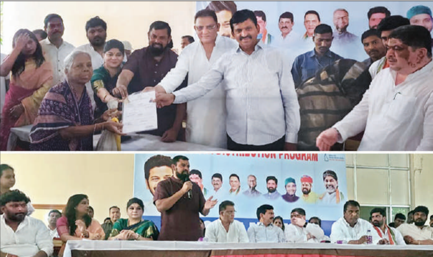
के वैध पट्टे एवं फ्लैट की चाबियाँ सौंपी गईं। इसके अतिरिक्त, सरकार की पुनर्वास योजना के तहत मार्कस घोड़े की कब्र 2बीएचके आवास परियोजना में 23 परिवारों को और मुरलीधर बाग क्षेत्र के 1 अन्य अत्यंत जरूरतमंद परिवार को भी पक्का आवास उपलब्ध कराया गया। चाबियाँ मिलते ही लाभार्थियों के चेहरे खुशी से खिल उठे।

हैदराबाद, 02 जुलाई (शुभ लाभ ब्यूरो): गोशामहल विधानसभा क्षेत्र में तेलंगाना सरकार द्वारा महत्वाकांक्षी 2बीएचके आवास योजना के अंतर्गत पट्टा एवं फ्लैट की चाबियों के वितरण का एक भव्य कार्यक्रम आयोजित किया गया। इस गौरवपूर्ण अवसर पर मुख्य अतिथि के रूप में तेलंगाना सरकार के राजस्व एवं आवास मंत्री श्री पोंगुलेटी श्रीनिवास रेड्डी, परिवहन मंत्री श्री पुन्नम प्रभाकर तथा गोशामहल विधानसभा क्षेत्र के स्थानीय विधायक श्री टी. राजा सिंह की गरिमामयी उपस्थिति रही। कार्यक्रम को सुचारू रूप से संपन्न करने के लिए हाउसिंग विभाग, माइनॉरिटी विभाग एवं हैदराबाद जिला प्रशासन के कई वरिष्ठ अधिकारी भी विशेष रूप से उपस्थित रहे। कार्यक्रम के अंतर्गत मुख्य रूप से धूलपेट-कुलसुमपुरा क्षेत्र के 145 चिन्हित पात्र परिवारों को उनके अपने 2बीएचके आवासों