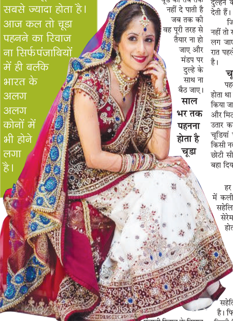
पंजाबियों में शादी के दिन होने

अगर आप किसी पंजाबी फ्रेंड की शादी में गई होंगी, तो आपने दुल्हन को चूड़ा पहने हुए जरूर देखा होगा। वैसे तो दुल्हनें ढेर सारी ज्वेलरी पहनती हैं मगर उनमें से चूड़े का महत्व सबसे ज्यादा होता है। आज कल तो चूड़ा पहनने का रिवाज ना सिर्फ पंजाबियों में ही बल्कि भारत के अलग अलग कोनों में भी होने लगा है।